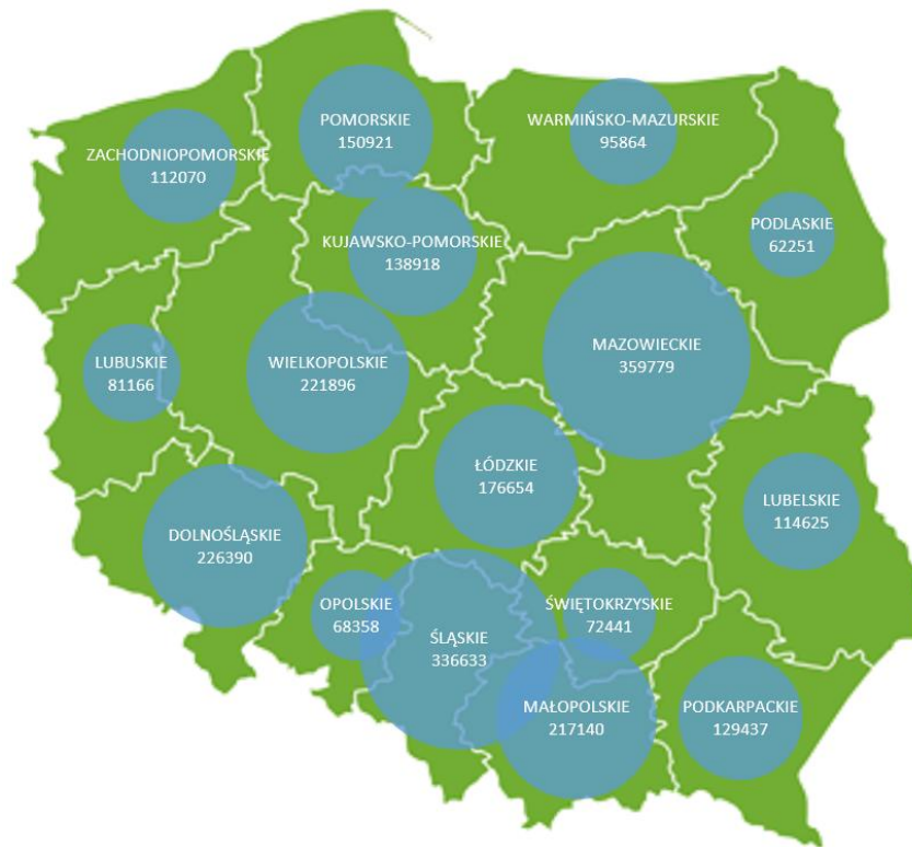
Tabela. Udział OSP w zdarzeniach w latach 2016-2020