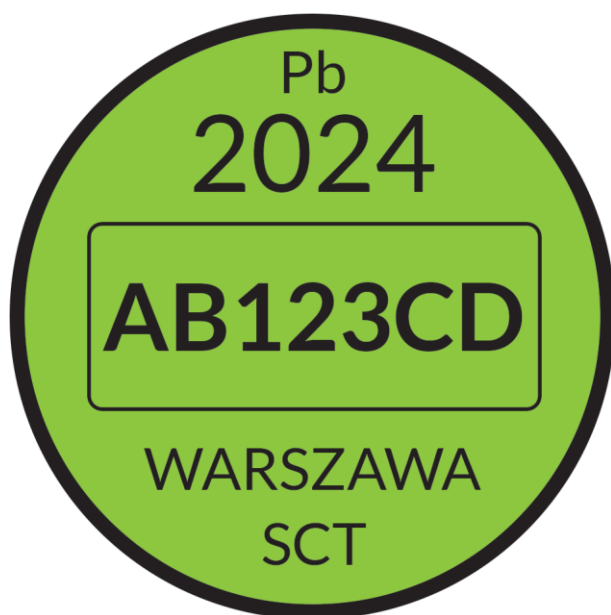
Rysunek 1. Wzór nalepki dla pojazdów uprawnionych do wjazdu do strefy czystego transportu